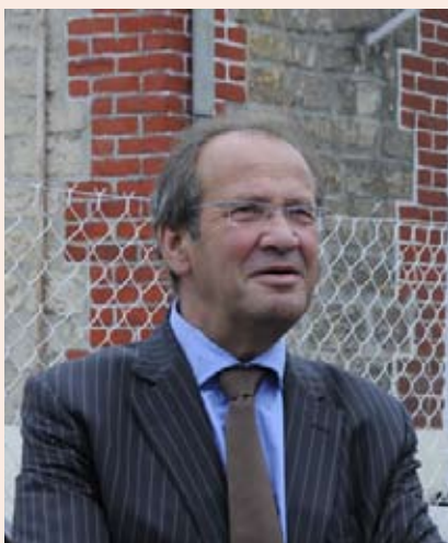
Yves Rome, président du Conseil général de l'Oise

Le Syndicat mixte des transports collectifs de l'Oise (SMTCO) a inauguré le 19 décembre dernier un système multimodal d'informations voyageurs en temps réel